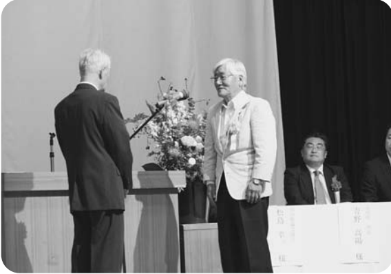
受賞者代表あいさつ