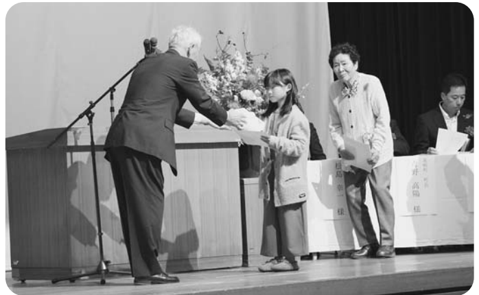
募金箱応募者の表彰の様子