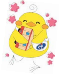
美咲町社協のキャラクター 「みしゃモン」