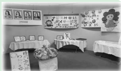
【障がい者アート～わたしの世界inみさき～】