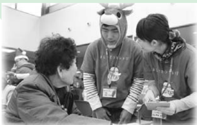
【みしゃモンカレッジ】