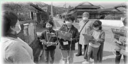
【ジュニアボランティア養成講座】