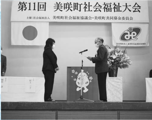
受賞者代表あいさつ